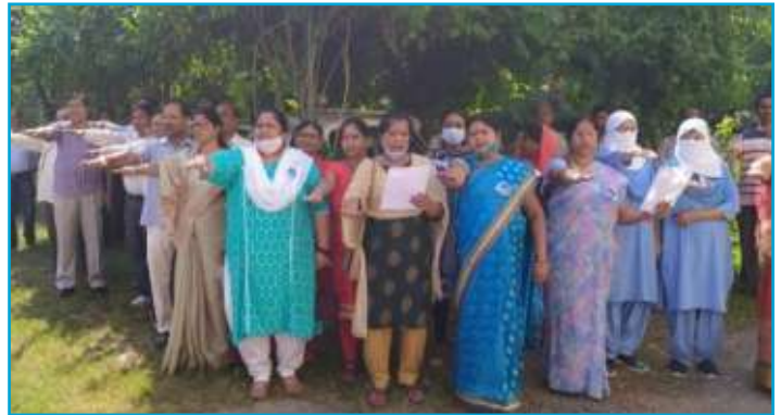
Administration of Integrity Pledge at Mankapur Plant