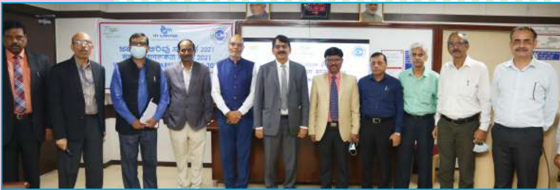
ITI Limited Observes Vigilance Awareness Week 2021