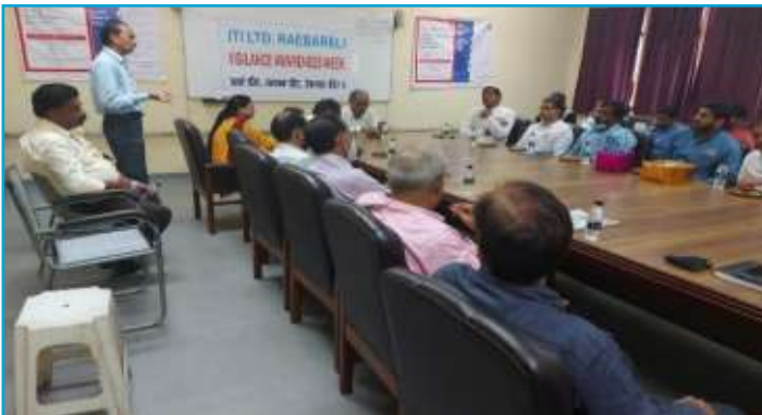
Interactive Seminar at ITI Raebareli Plant