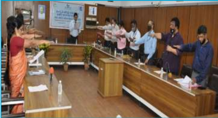
Administration of Integrity Pledge at Bangalore Plant