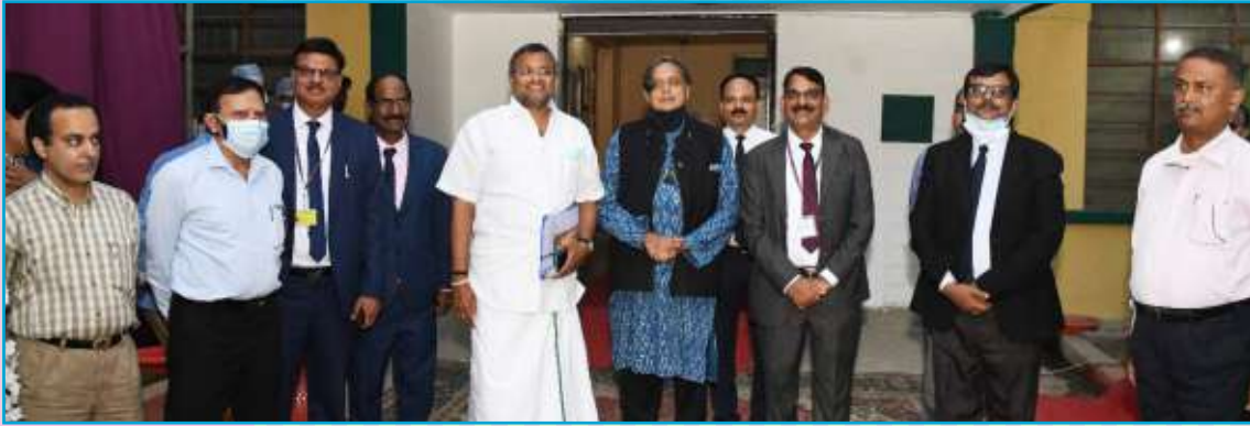
Parliamentary Standing Committee on Information Technology Visits ITI Srinagar Plant