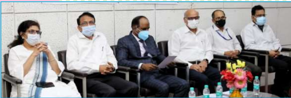
ITI Limited Organizes Customer Meet 2021