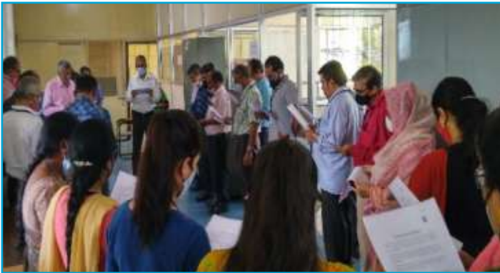
Administration of Integrity Pledge at Corporate Marketing Department