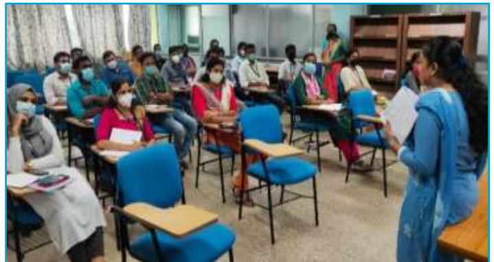
Workshop on Official Secret Act Policy & CDA Rules at Palakkad Plant