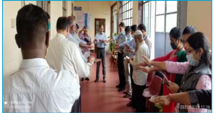
Administration of Integrity Pledge at NS Unit